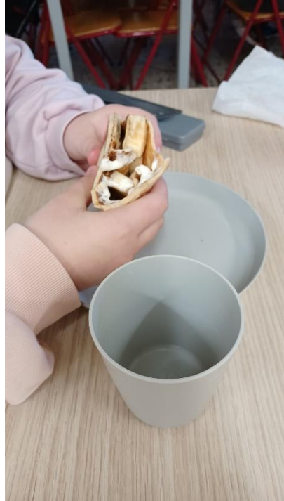
Μάρτιος, μήνας γαλλοφωνίας