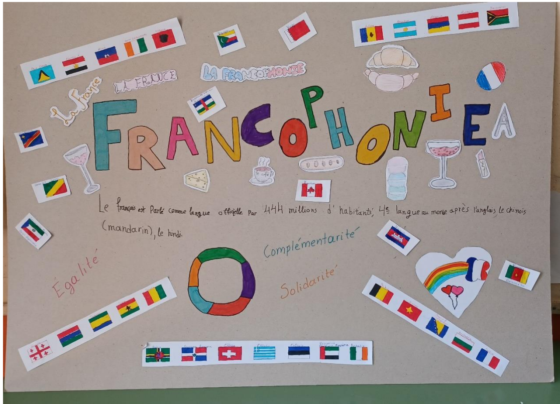
Υπεύθυνη εκπαιδευτικός: Ελισάβετ Κρίπα