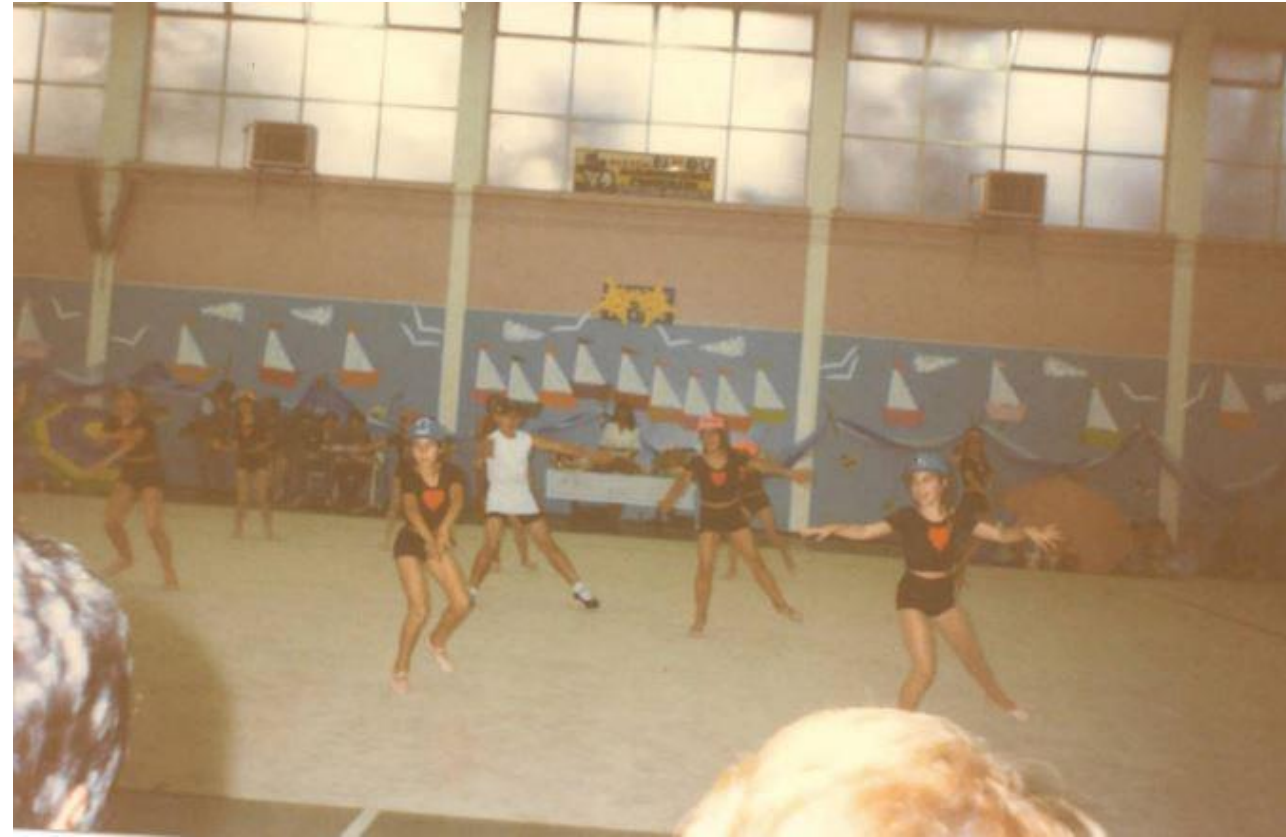
Καλοκαιρινή γιορτή μαθητών 3ου Δημοτικού Σχολείου - Τμήμα παραδοσιακών χορών. Ακαδημαϊκό έτος '94-'95. Καλοκαιρινή παράσταση στο κλειστό γυμναστήριο Νέας Ιωνίας. Τμήμα μπαλέτου του Δήμου. Ακαδημαϊκό έτος '94-'95. Προσωπικό αρχείο.